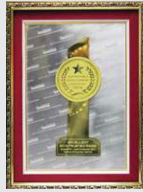
Huân chương Lao động hạng 3

theponghoaphat.com.vn 09861643181 - Mr Dũng - cung cấp chuyên thép Hòa Phát