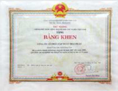
Bảng khen của thủ tướng Chính Phủ