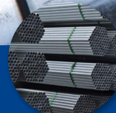
ỐNG MẠ NHÚNG NÓNG